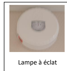
Lampe à éclat