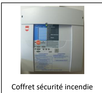
Coffret sécurité incendie

Une surveillance incendie (6 détecteurs) est située entre le plafond et la toiture, ces détecteurs surveillent ce que vous ne voyez pas et en cas de problème, ils envoient l'information au coffret situé sur votre gauche en entrant dans la salle. Deux sirènes (une dans l'entrée de la grande salle l'autre dans le couloir des toilettes) ces sirènes retentiront alors pendant 5 minutes, pour les personnes malentendantes, une lampe à éclats située dans les toilettes handicapés les avertira du danger.